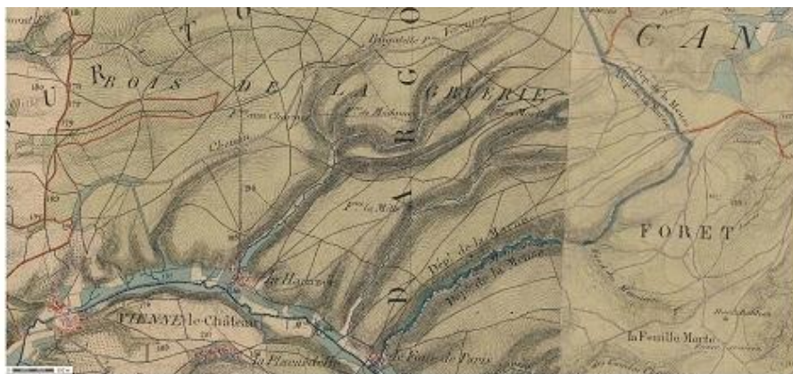
Carte du secteur Fontaine Madame - Extrait de la carte d'État-major

Disparu le 30 juin 1915 à Fontaine-Madame.