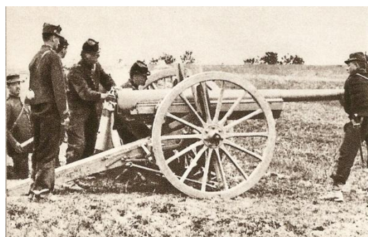
Ci-contre canon de 75 mm

Engagé volontaire pour 4 ans le 20 décembre 1916, à la mairie de Toulouse au titre du 23 e régiment d'artillerie, arrivé au corps et soldat de 2 e classe le 21 décembre 1916.