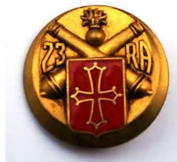
Insigne du 23 e RA