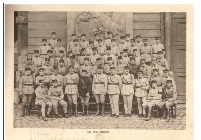
1 er Génie à Versailles : 2 ème rang, 4 ème à partir de la gauche