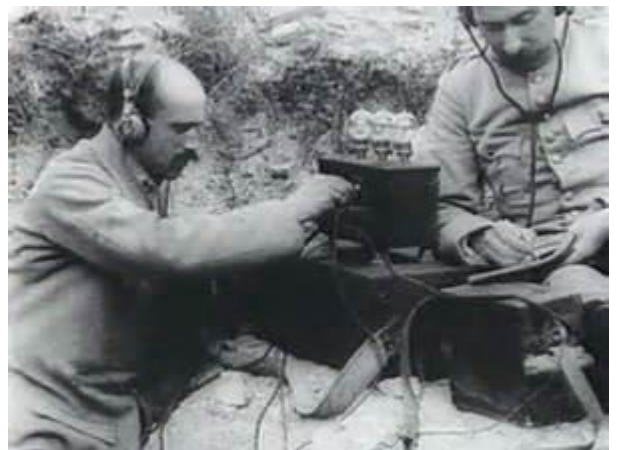
Ci-contre sapeurs télégraphistes en action

Passé au 11 o régiment du génie (décision ministérielle du 12 mars 1918).