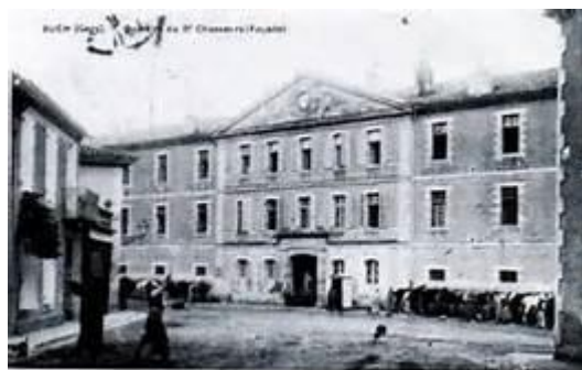
9 e régiment de chasseurs à cheval, à Auch ( jean-louis N. )

A accompli une 1 ère période d'exercices dans le 9 e régiment de chasseurs du 5.03 au 1 er .04.1893.