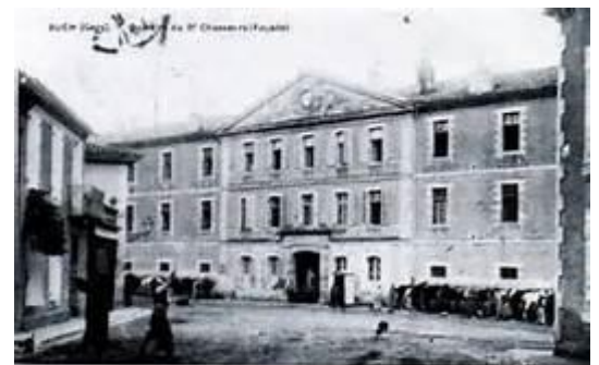
9° régiment de chasseurs à cheval, à Auch ( jean-loais N. )

Lors de la Grande Guerre, il s'illustre à Verdun (1916), aux Soissonnais (1918) et à L'Ailette (1918).