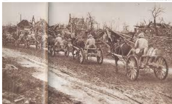
La photo ci-contre présente un ravitaillement en munitions par un escadron du Train (date et lieu non précisés)

Envoyé en congé illimité de démobilisation le 8 mars 1919, au dépôt démobilisateur du 17 e escadron du Train de Montauban, se retire à Toulouse, 5 rue saint Sylve.