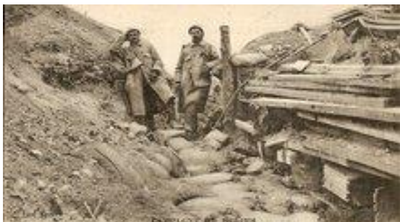
Tranchée du Bois Trapèze Mesnil les Hurlus