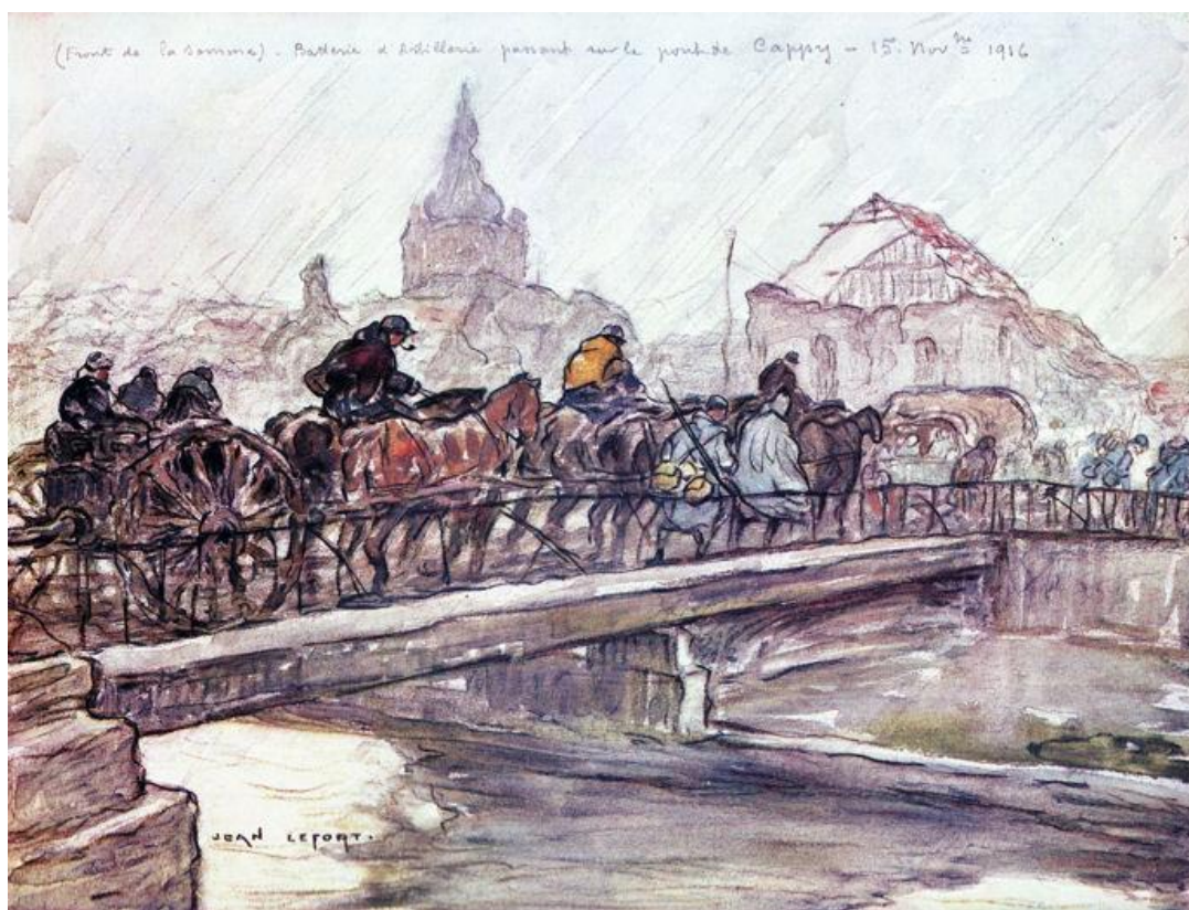
Batterie d'artillerie traversant sur le pont de Cappy (Aquarelle de Jean Lefort).

Contre l'Allemagne : du 3.08.1914 au 10.10.1917.