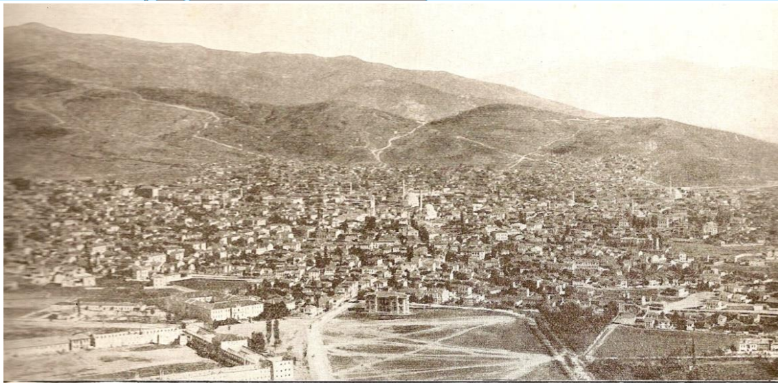
MONASTIR. — AU FOND, LES LIGNES DE TRANCHÉES ET LA COTE 1248