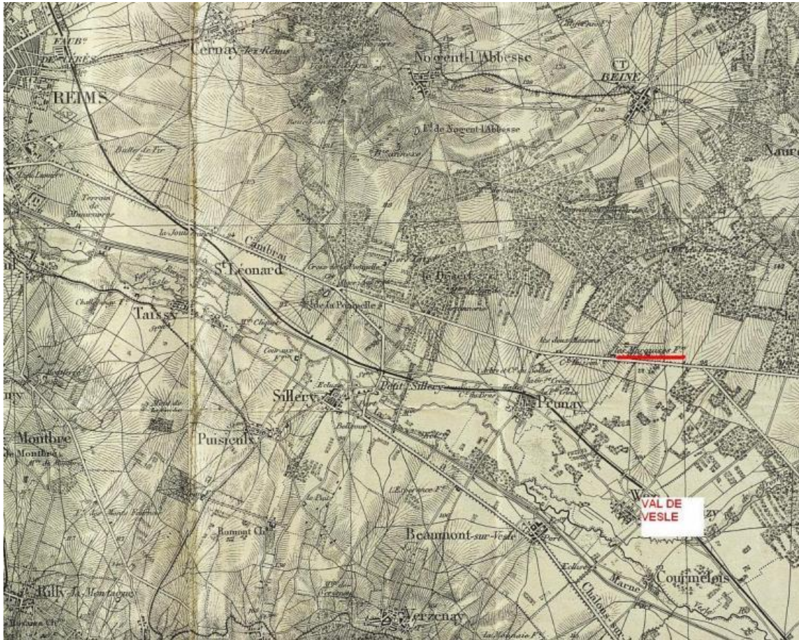
Ndr : Wez (Marne), à 17 km au sud-est de Reims, se nomme Val de Vesle depuis 1965.