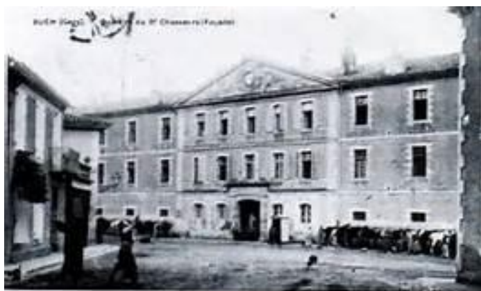
9 e régiment de chasseurs à cheval, à Auch ( Jean-Louis N. )

A accompli une 2 e période d'exercices au 9 e régiment de Chasseurs du 1 er au 17 novembre 1913.